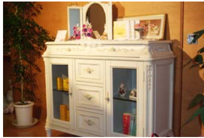
◆アロマティックサロン nika(ニケ) http://www.salon-nike.com