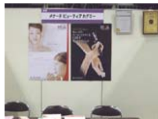
会場に出展したアカデミーのブース

その学生を応援する企画の一つとして、就職を有利に進めるための資格取得や技術習得を目的とするスクールが、ブースを出展。アカデミーでは美容系の仕事を目指す方に、メイクアップやエステティックの資格についてご紹介しました。