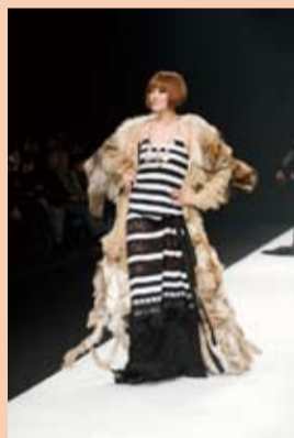
秀香さんの登場に会場は大歓声