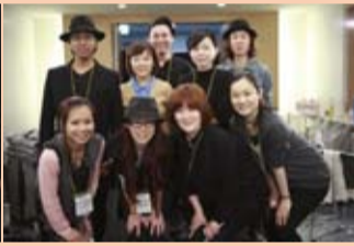
今回のヘア&メイクチーム